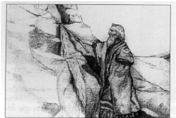
Fig. 117 - Mosè fa sgorgare l'acqua dalla roccia

Scorrendo la storia scopriamo che quando le legioni romane avanzavano verso la Gallia e la Germania, i loro eserciti erano preceduti da "portatori di bacchette," la cui missione consisteva nel trovare l'acqua, spesso sotterranea, essenziale per il rifornimento dei soldati. In questo modo fu scoperto anche un certo numero di fonti termali.